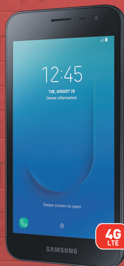
Samsung Galaxy J2 Core (2)