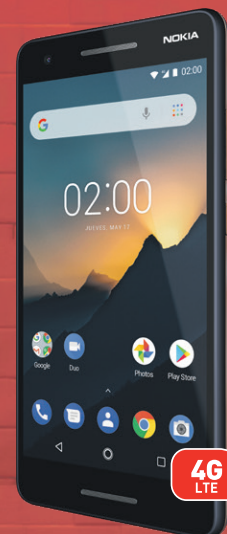
Nokia 2.1 (2)